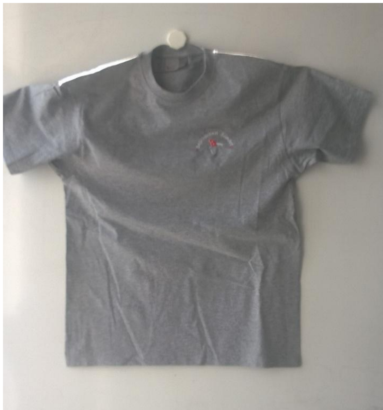
T-Shirt, Sportsgrey, 110,-kr