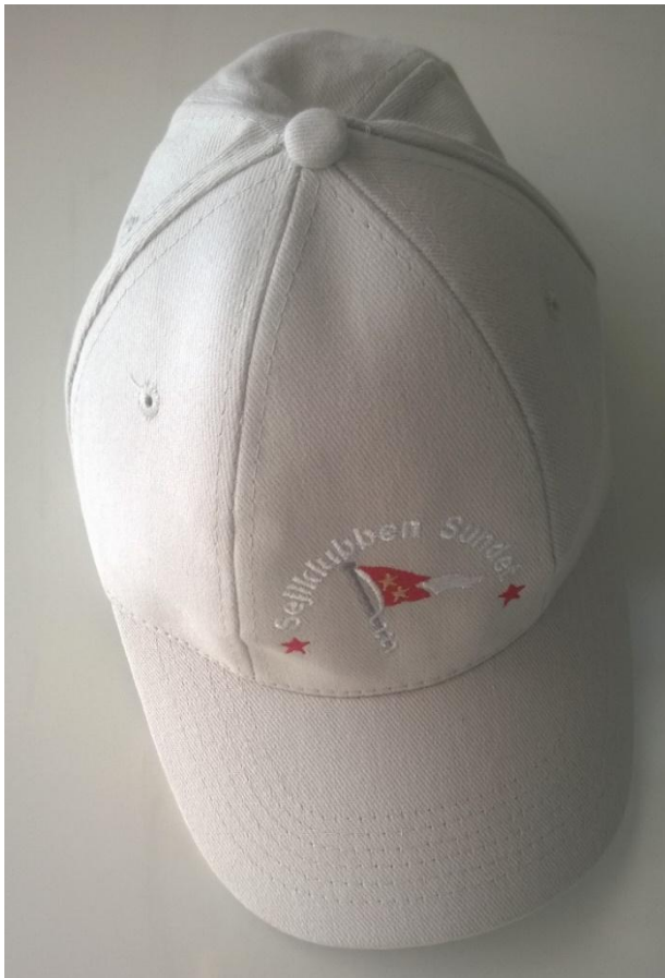
Cap, Grey, 75,-kr