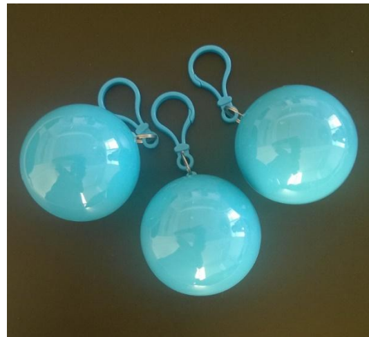
Poncho, blue, 15,-kr