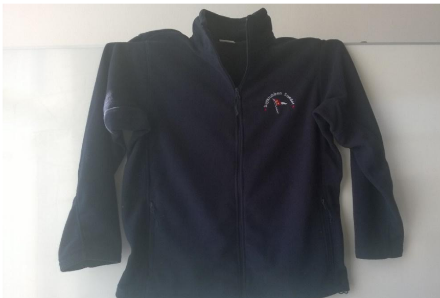
Fleece trøje, Navy, 300,-kr