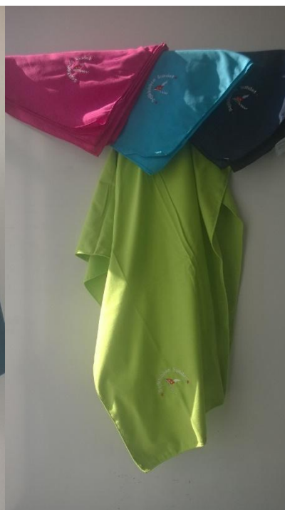
Håndklæder, fuschia, light navy, lime, tropical Blue, 190,-kr