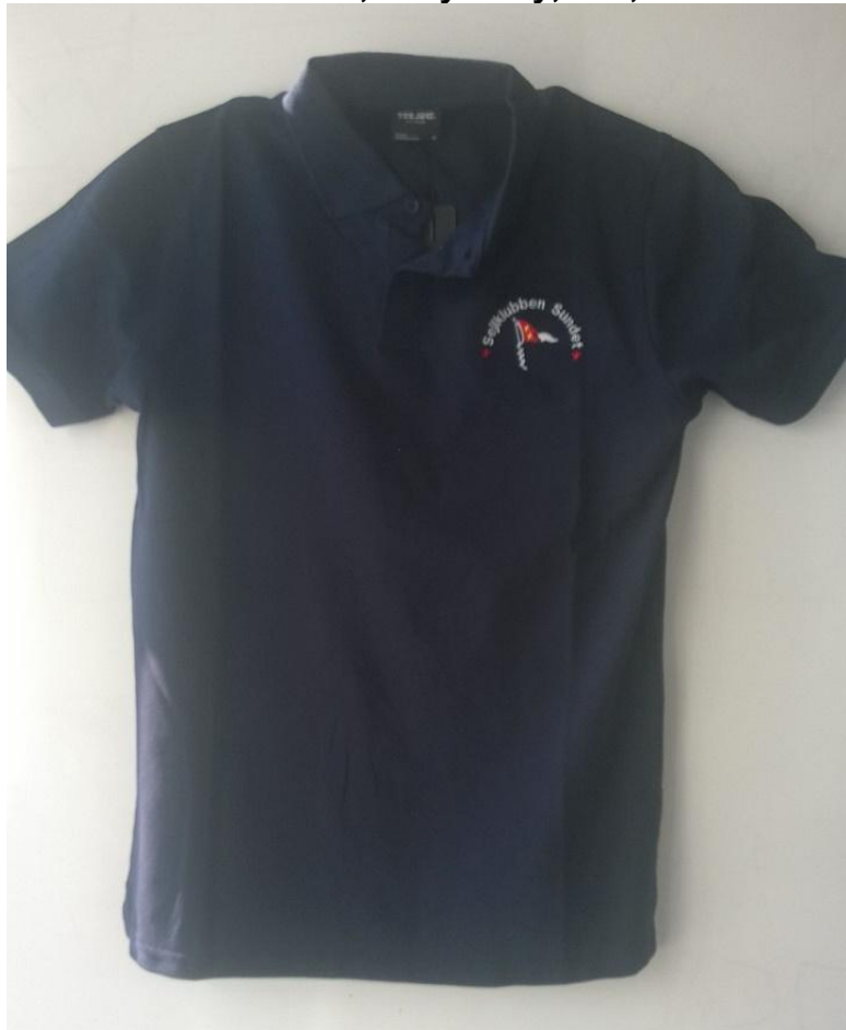
Polo t-shirt, Navy, 200,-kr