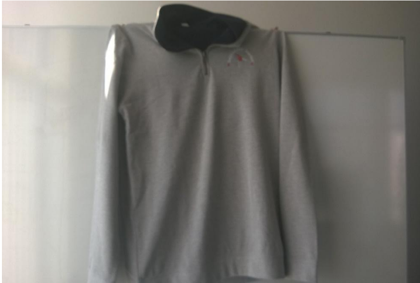
Sweat shirt, Grey/Navy, 280,-kr