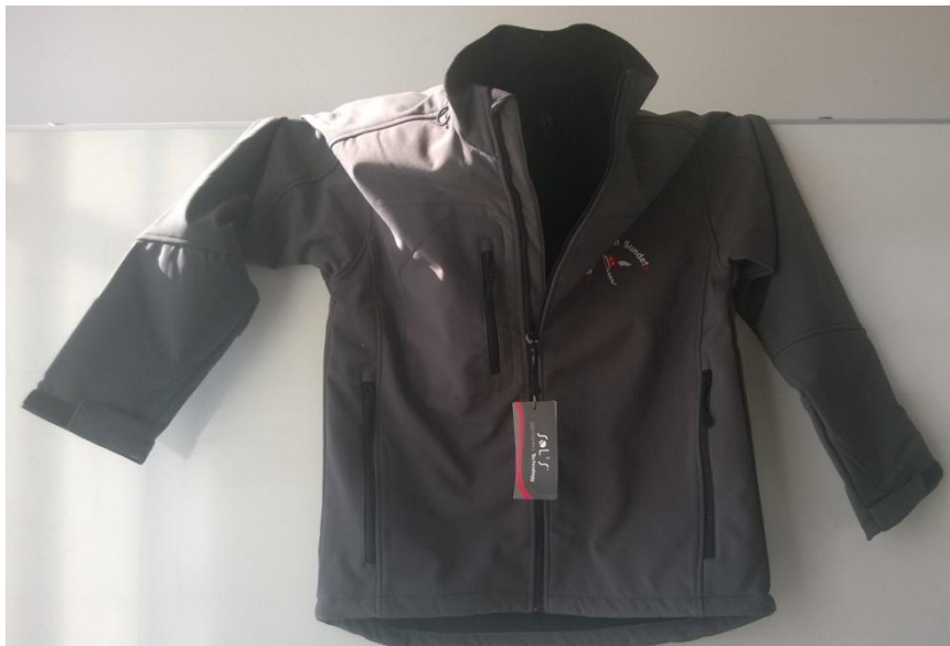
Soft Shell Jakke, Grey, 480,-kr

Så er det nye klubbtøj ombord og vi glæder os til at sælge ud af t-shirts, polo'er, sweatshirts, fleecejakker, soft shell jakker, kasketter, håndklæder, kanvas net, tasker og poncho's. Sejlklubben Sundets logo er pænt broderet på det hele. Se billeder og priser på tøjet herunder.