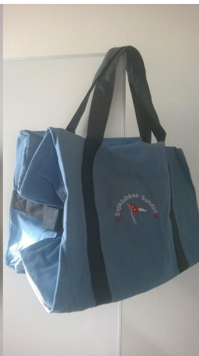
Taske, petroleum, 310,-kr