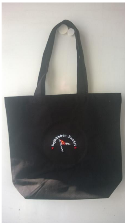
Kanvas net, black, 60,-kr